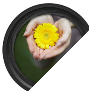
Diaframma luminoso F2.0