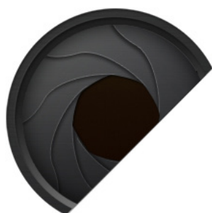
Apertura circolare con 9 lamelle