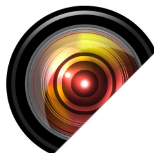
Tecnologia UMC (Ultra Multi Coating)